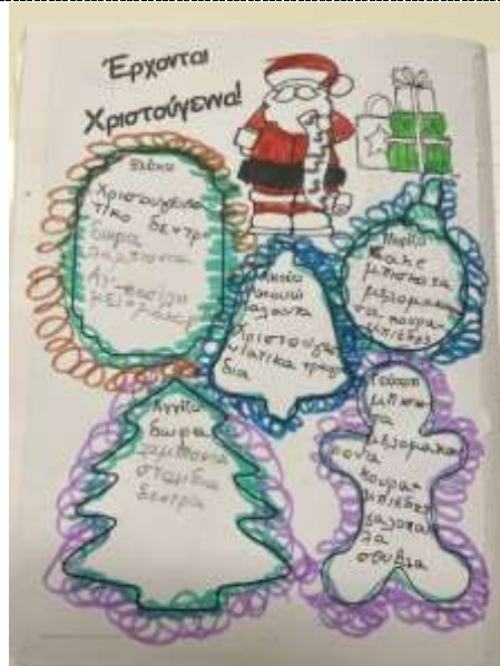
Τα Χριστούγεννα μέσα από τις πέντε αισθήσεις.